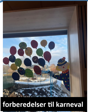
forberedelser til karneval