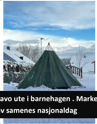
Lavo ute i barnehagen . Marker av samenes nasjonaldag