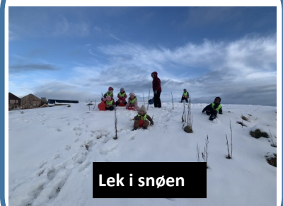
Lek i snøen