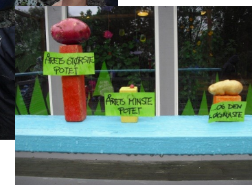
Potetoptak. Etterpå har vi potetfest!