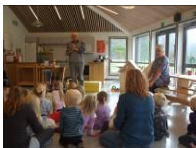
Tilja og Tofta

Tidleg i haust fekk me oppleve samisk musikk gjennom trommer og song. Det var i regi av rikskonsertane. Sjølve førestilling var ute i grillhytta vår, og stemning rundt bålgrya var god. Me vart oppfordra til å delta i songen, men samisk er ikkje sååå enkelt å syngja...På tross av dette klarte nokon av barna å gjette kva for eit dyr dei song om, blant anna ein hund. Heilt tilsutt fekk me prøve oss på Ante songen, den var litt enklare og truleg meir kjent for oss vaksne. Kanskje nokon hugsar den frå Barne-tv.