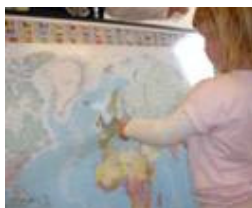
Arbeid med land i verda.