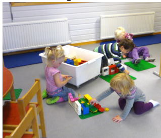
Leik i barnehagen.