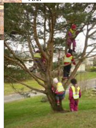
Kjekt å klatre i tre.