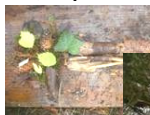
Landart, forming ute.