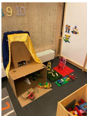
Duplo og togbane er populært på Straen

På planleggingsdagen jobbet vi litt med lekemiljøet på avdelingen. Vi jobber med voksenrollen i leken, samt lekekrokene. Mandag etter planleggingsdagen var det ommøblert på avdelingen, og barna satt i gang med lek med en gang de kom denne dagen.