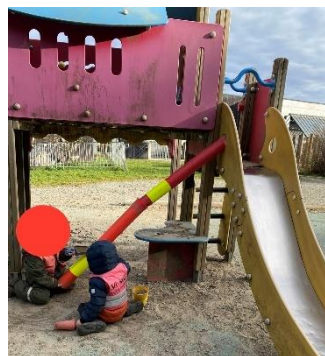
Her har noen barn bygget et sementrør.

I sandkassen har vi hatt kafé med mange deilige og smakfulle kaker, vi har laget vulkan og elver. Her har vi samarbeidet og snakket sammen for å planlegge hvordan det skal se ut.